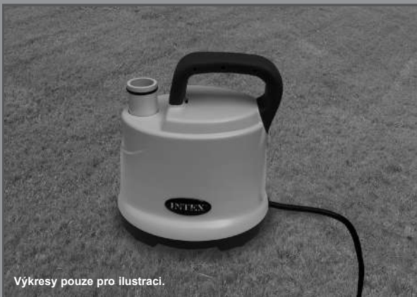
Výkresy pouze pro ilustraci.

Nezapomeňte vyzkoušet i jiné skvělé výrobky Intex: bazény, bazénové příslušenství, nafukovací bazény a domácí hračky, matrace a lodě, které jsou k dispozici u znamenitých prodejců, nebo navštivte naše webové stránky.